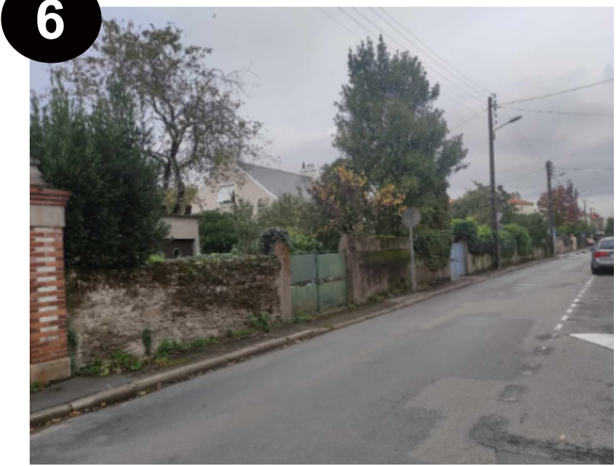
6 LA RUE CALME, ON PEUT ENTENDRE LA NATURE

6 Il y a une grande route, à la sortie de l'école il y a pleins de voitures qui circulent. Les gens parlent *Bla bla* . C'est un endroit calme, il est possible d'entendre le chant des nombreux oiseaux *Cui cui* , c'est très agréable. On entend aussi le bruit des trottinettes des copains, il y en a beaucoup. Vers le rond-point de la Loire, il y a peu d'enfants. Les gens marchent dans la rue *Clac clac* .