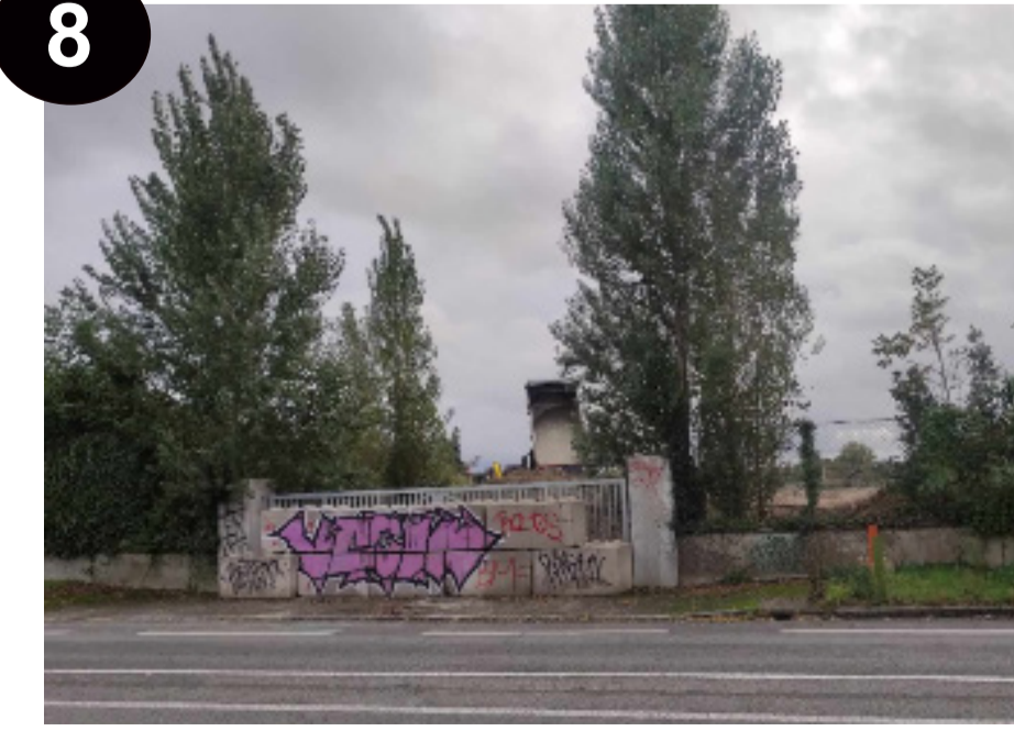
8 C'EST LE CHANTIER !

8 On entend la pluie qui tombe dans les flaques d'eau *Flac flac* et le vent qui fait bouger les feuilles dans les arbres *Pshh* . Le vent des fois on l'entend, des fois on ne l'entend pas. Il y a des oiseaux qui chantent mais il y a aussi beaucoup de voitures qui passent vite en faisant du bruit. Devant le chantier, c'est vraiment vraiment fort. On entend la grue qui monte tout en haut, le tractopelle qui roule, la pelleuse qui creuse *CRUNCH* et le marteau piqueur qui tape fort *POC POC POC* . Les camions de chantier font aussi beaucoup de bruit et on entend une sirène quand ils reculent. Il y a aussi un chien qui aboie et des gens qui parlent entre eux. Parfois, quand le chantier est plus calme le soir, on peut entendre les avions *NIAOOU* qui passent, mais c'est toujours très agité ici.